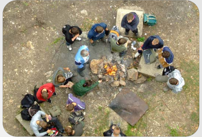
Őszi kirándulás a Naszályban