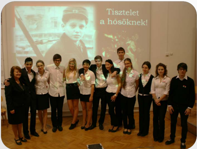
Az október 23-i megemlékezésen a 10.G osztály adta az ünnepi műsort, amelyben a korabeli külföldi híradásokat mutatták be