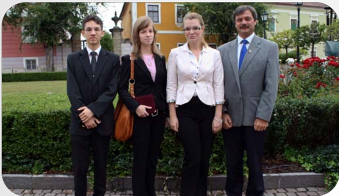
Kitüntetett kiváló tanulóink